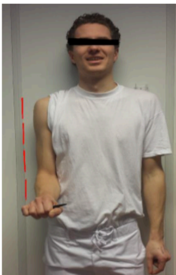
Figure 1C – Elbow pronation