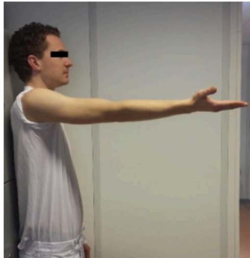
Figure 1B – Elbow extension